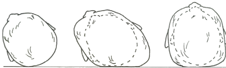
Normaali kallon muoto

Yksipuolinen nukkumisasennon suosiminen sängyssä tai vaunuissa, pitkä oleskelu sitterissä tai turvakaukalossa samoin kuin yksipuolinen imetys- tai pulloruokinta-asento saattaa korostaa vauvan vinopäisyyttä, takaraivon littanaisuutta tai pään liikkeiden rajoitteisuutta.