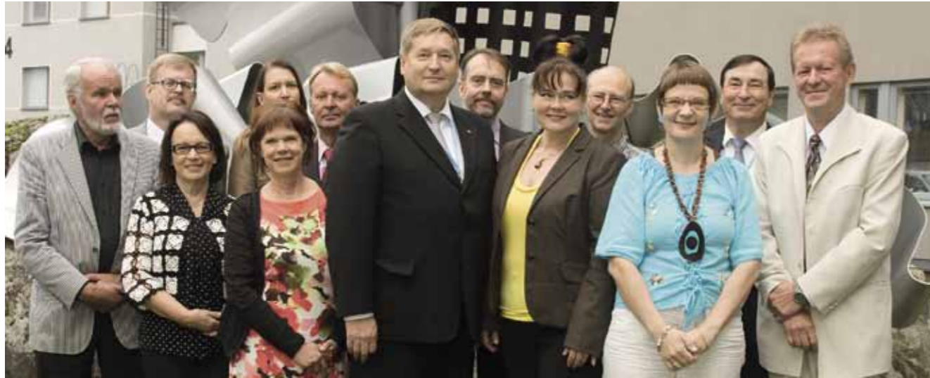
Kuntayhtymän uusi hallitus 11.6.2013 alkaen.