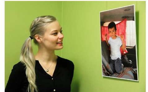
Maailmalla Riikka Myöhänen, KYSin valokuvaaja